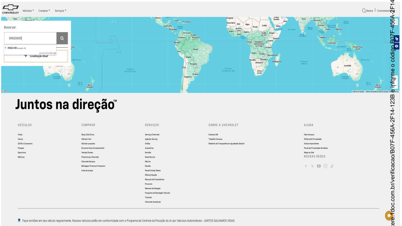
Imagem 1. Acesso ao sítio eletrônico oficial da Chevrolet [https://www.chevrolet.com.br/localizar-concessionaria] em 11/11/2024, às 15:26 - Primeiro passo inserir o CEP.

Verifica-se que não há como praticar a concorrência, propriamente dita, pois se refere à prestação de serviço mecânico, nesse caso, à revisão programada, incluindo a substituição de determinadas peças, sendo certo que a garantia técnica do fabricante somente é mantida se ditas revisões forem realizadas nas oficinas de suas concessionárias autorizadas, em que, no caso em tela, na cidade de Xanxerê, a concessionária é a empresa DM Auto, a qual tem abrangência na cidade de Xanxerê e região, conforme pesquisa realizada no mercado local e no site do próprio fabricante.